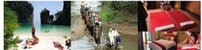
ธุรกิจสุขภาพและความงาม สปา นวดแผนไทย